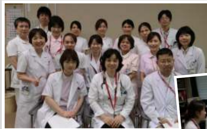
糖尿病療養指導チーム

糖尿病足病変の患者様については、フットケア外来も開設しております。糖尿病の場合にはうおのめ・たこ・水虫といった比較的良好であるものが、感染合併等を契機に急速に悪化して「壊疽」を生じ、重篤化する可能性があります。お困りの糖尿病患者様がおられましたら、是非ご紹介下さい。