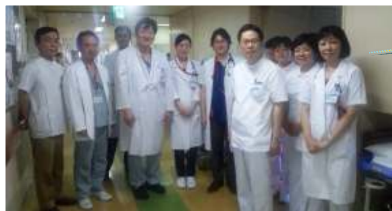
循環器内科チームです。

救急診療においては東京都CCUネットワークに加盟し、循環器救急疾患の患者受け入れに努めております。当科では今後も人的、環境的、そして物質的な充実を図り、高い医療水準を維持して診療に臨む所存です。今後とも皆様のご支援、ご協力をお願いいたします。