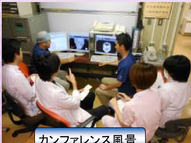
カンファレンス風景