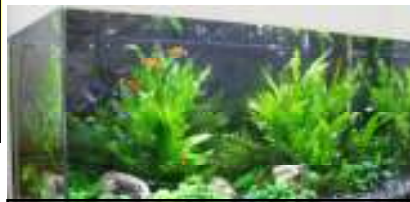
小児科外来に水槽を設置しました。 稚魚もいますので、探してみてください。