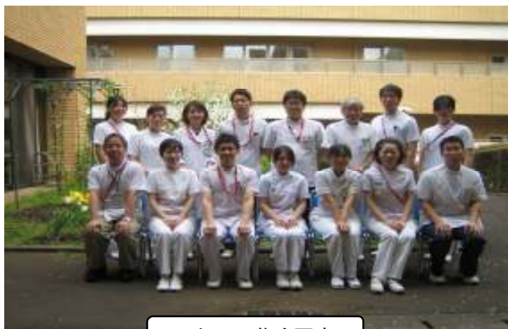
スタッフ集合写真