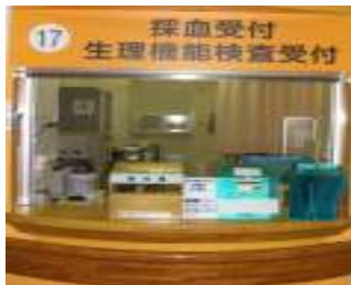
採血・採尿受付 17番

採血室では外来患者さんの血液検査や尿検査の受付を行い、検査のための採血、採尿を行っています。採血スタッフ（看護師と臨床検査技師）が安全で安心できる採血を心掛け対応しています。