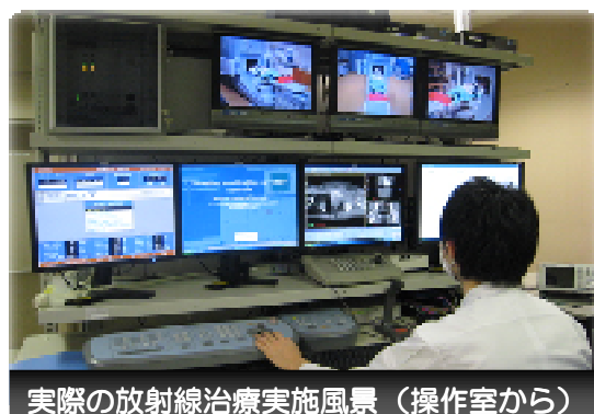
実際の放射線治療実施風景 (操作室から)