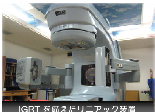
IGRT を備えたりニアック装置